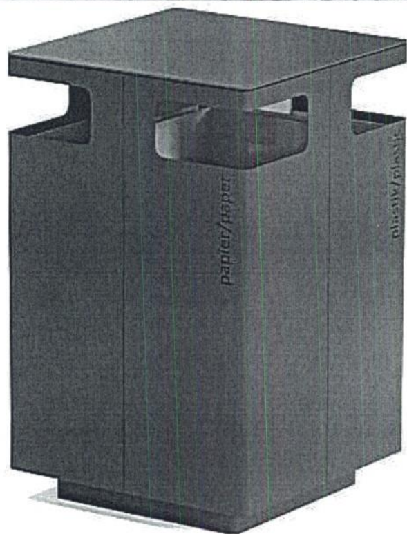
Załącznik nr 2